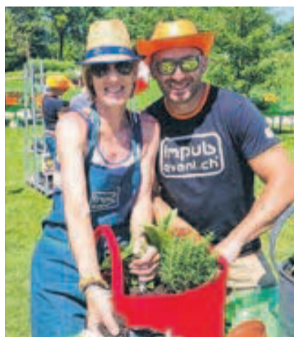
Die Firma Impuls-Event kann ihre Erlebnisse zurzeit nicht anbieten.

Start: Die Lakers begannen ihre Playoff-Serie in Lugano. SEITE 19